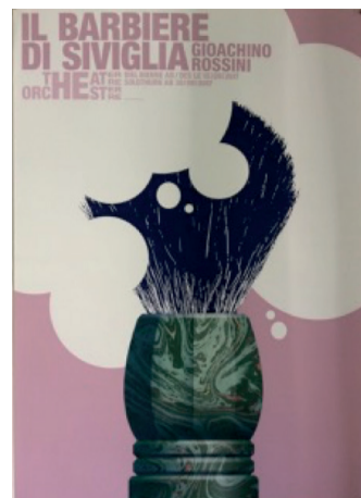
Il Barbiere di Siviglia Bundi Stephan 2017

Bifangstrasse 17a | CH-5430 Wettingen SA/SO 14 – 17 Uhr museum@eduardspoerri.ch www.eduardspoerri.ch