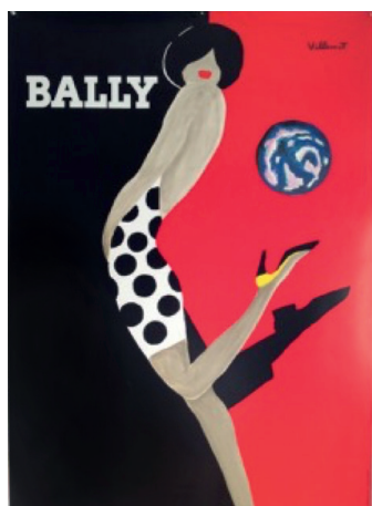
Bally Villemot 1989

Schlossgasse 23, CH 5600 Lenzburg 062 891 66 70 DI bis SA, 14.00–17.00 Uhr SO, 11.00–17.00 Uhr burghalde@lenzburg.ch