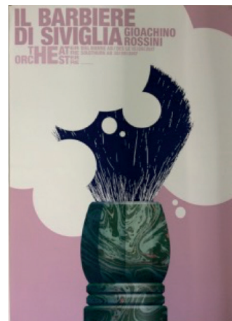
Il Barbiere di Siviglia Bundi Stephan 2017

Bifangstrasse 17a | CH-5430 Wettingen SA/SO 14 – 17 Uhr museum@eduardspoerri.ch www.eduardspoerri.ch