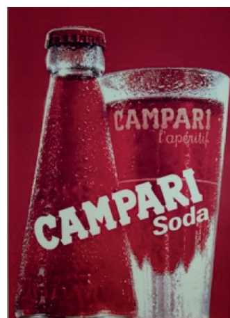
Campari Soda Michels Sergio 1979